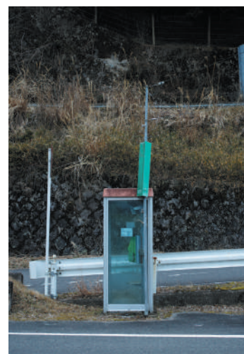
「公衆電話」 マシクオ