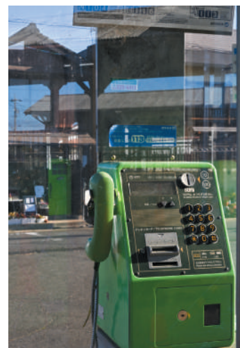
「受話器をとってアノノ」 竹内正之